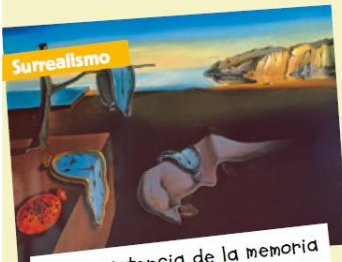
Surrealismo La persistencia de la memoria (Salvador Dalí, 1931) Reflejan el subconsciente y lo irracional.