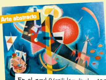
Arte abstracto En el azul (Vasili Kandinsky, 1925) No se representan objetos o figuras de la realidad.

A partir de 1945, las vanguardias se renovaron de forma muy rápida: expresionismo abstracto, pop art, hiperrealismo , etcétera.