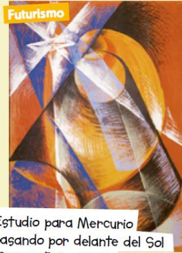
Futurismo Estudio para Mercurio pasando por delante del Sol (Giacomo Balla, 1914) Reivindican el futuro, la modernidad, la velocidad y las máquinas.