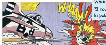
Whaam! (Roy Lichtenstein, 1963) El pop art se inspiró en los cómics, la publicidad, el cine, etc.

A partir de 1945, las vanguardias se renovaron de forma muy rápida: expresionismo abstracto, pop art, hiperrealismo , etcétera.