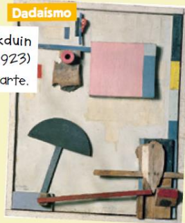
Dadaísmo Merzbild Kijkduin (Kurt Schwitters, 1923) Proclamaban la destrucción del arte.