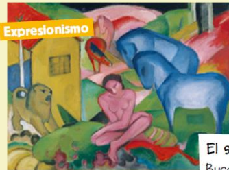
Expresionismo El sueño (Franz Marc, 1912) Buscaron expresar los sentimientos.